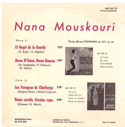
back (tracks 1 & 4 in italian)