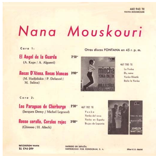
back (tracks 1 & 4 in italian)